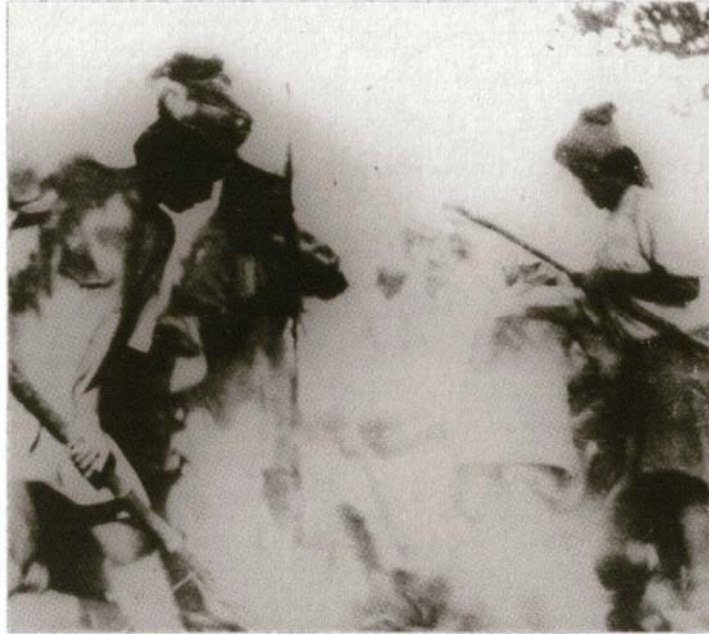
ਗੁਰੂ ਕਾ ਬਾਗ. 1922.

ਅਪਣੇ ਬਾਪ ਦੀ ਹੋ ਰਹੀ ਬੇਪਤੀ ਦੇਖ ਰਿਹਾ ਹੈ। ਉਦੋਂ ਕੈਮਰੇ ਦੀ ਰਫਤਾਰ ਸਹੀ ਨਹੀਂ ਸੀ ਹੁੰਦੀ ਅਤੇ ਮੰਦ-ਰਫਤਾਰ ਨਾਲ ਬਣਾਈ ਮੂਵੀ ਵਿਚ ਜਣੇ ਚਾਬੀ ਦਿੱਤੇ ਖਿਡੌਣਿਆਂ ਵਾਂਗ ਨੱਸਦੇ ਜਾਂਦੇ ਲਗਦੇ ਹਨ। ਪੰਜਾਬ ਦੇ ਇਤਿਹਾਸਕ ਮੌਕਿਆਂ ਦੀਆਂ ਫੋਟੋਆਂ ਨਾਂ-ਮਾਤ੍ਰ ਹੀ ਮਿਲਦੀਆਂ ਹਨ - ਕਿਸਾਨ ਮੋਰਚਿਆਂ, ਸੰਨ ਸੰਤਾਲੀ, ਸੰਨ 65 ਤੇ 71 ਦੀਆਂ ਜੰਗਾਂ ਦੀਆਂ, ਚੁਰਾਸੀ ਦੇ ਵਰਤੇ ਭਾਣੇ ਦੀਆਂ।